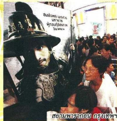
สยามพารากอน กรุงเทพฯ