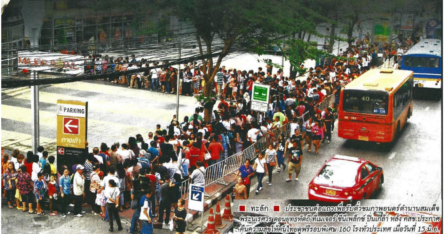
■ ทะลิก ■ ประชาชนคือแถวเพื่อรับตัวฆาตกรคดียานสมเด็จ พระนเรศวร ตอนยุทธหัตถีที่เมเจอร์ ซีนีเพิลิกซ์ ปิ่นเกล้าฯ หลัง คลสช.ประกาศ ระงับความสุขให้คนไทยดูฟรีรอบพิเศษ 160 โรงทั่วประเทศ เมื่อวันที่ 15 มิ.ย.