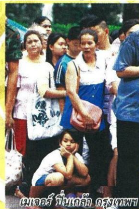
เมเจอร์ บินเกล้า กรุงเทพฯ