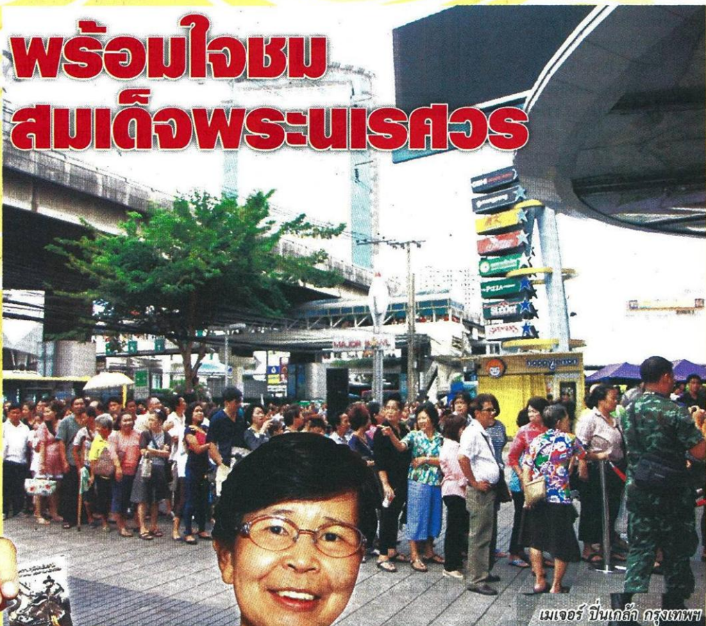
เมเจอร์ บินเกล้า กรุงเทพฯ