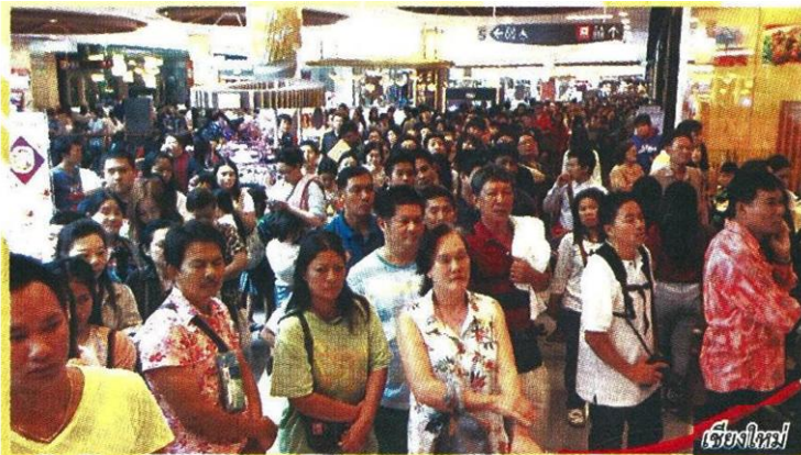
เชียงใหม่