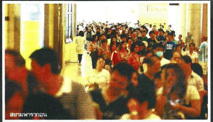
สยามพารากอน