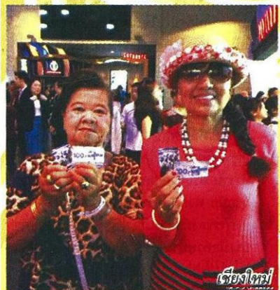
เชียงใหม่